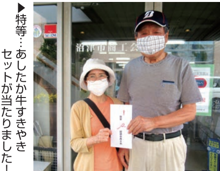
▶特等...あしたか牛すきやき セットが当たりました!

き換えをお願いいたします。抽選券をお持ちの方で、まだ当選番号を確認していない方は、この機会に改めてご確認ください。当選番号は、わが街の便利屋さん(沼津市商工会事務所の隣)、沼津市商工会ホームページの他、地区回覧でもご確認いただけます。