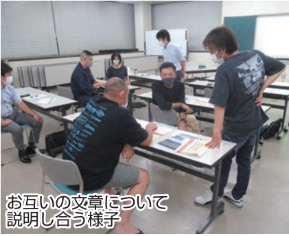
お互いの文章について説明し合う様子

新型コロナウイルスの感染拡大や、それに伴い加速するデジタル化等により、小規模事業者を取り巻く環境にも大きな変化が起っています。こういった経営環境の変化に対応するには、自社の強み・弱みを再認識し、新商品・新サービスの提案や既存商品のブラッシュアップをしていくことが必要です。そのためにも必要なのが『事業計画の策